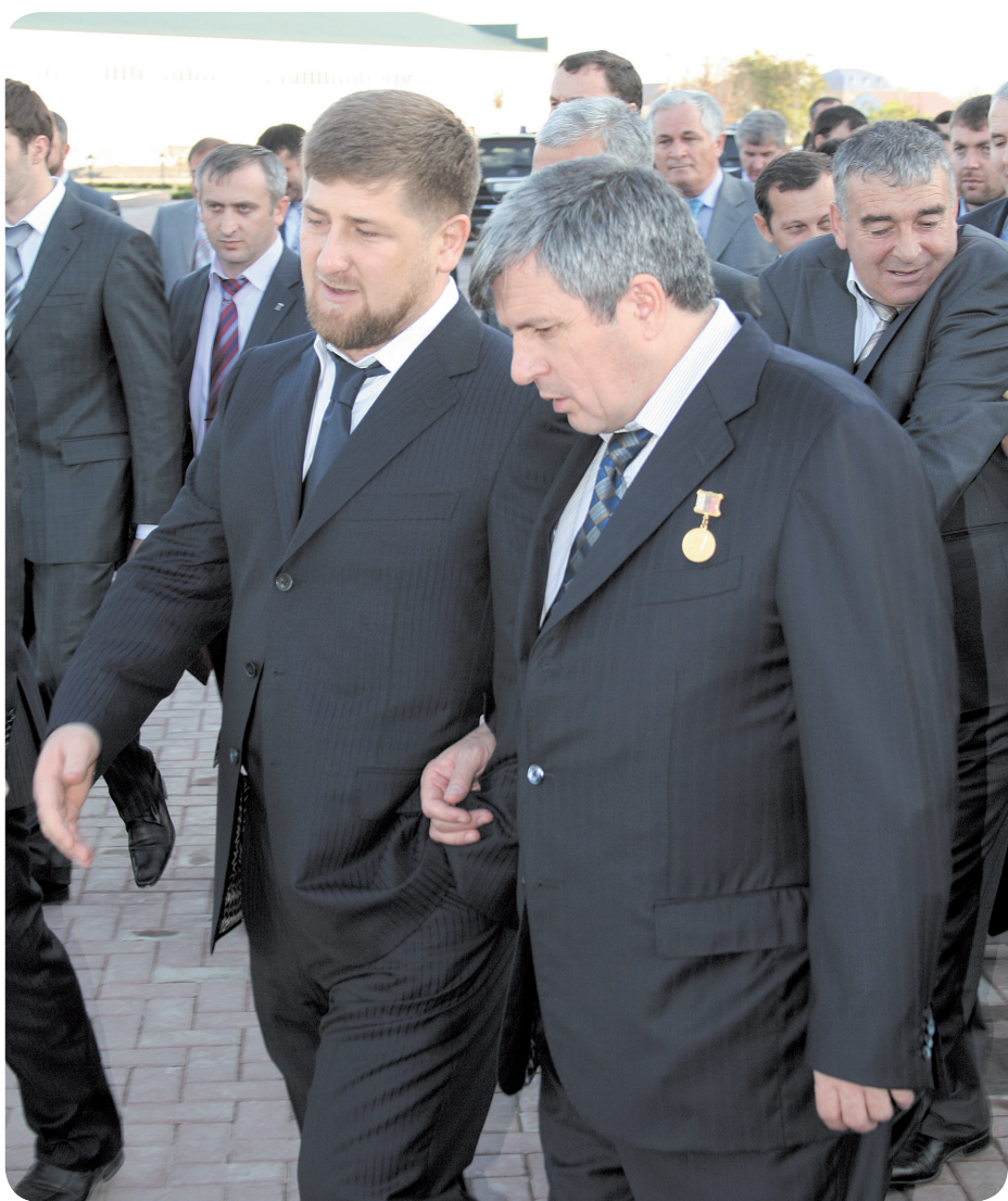
Рамзану Кадырову и Дукувахе Абдурахманову всегда есть, что обсудить

а ряд вопросов корреспондента газеты «Терские ведомости» ответил председатель Парламента ЧР Дукуваха Баишаевич Абдурахманов.