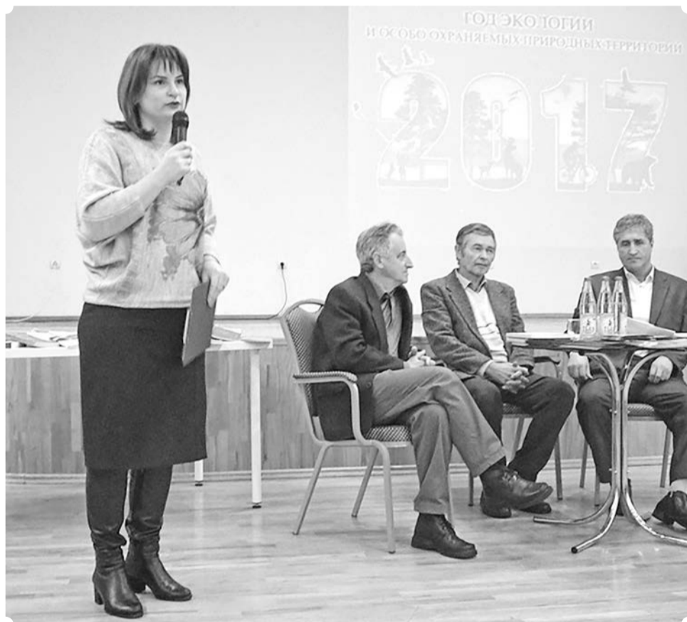
Состоялся заинтересованный разговор о роли Северо-Осетинского заповедника в экологическом балансе республики